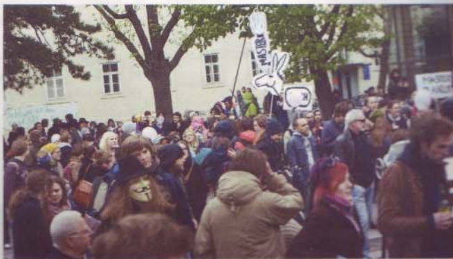
Studierende und Lehrende der IE beim Aktionstag am 13. April

Folge solcher „Qualitätsmaßnahmen“ ist jedoch, dass die Buchwissenschaft in beschränkte Studienpläne wandelt werden.